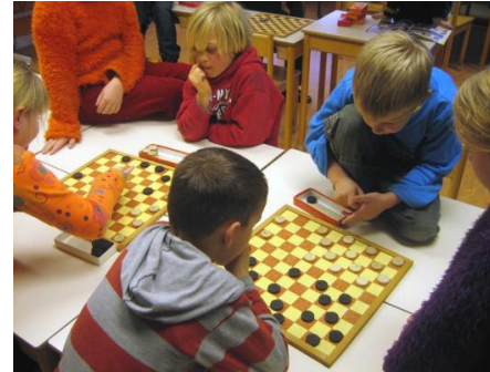
Schooldammen in Lollum

Er zijn 45 scholen in Franeker en omgeving aangeschreven om hier aan mee te doen. Het doel hiervan is om de kinderen in contact te laten komen met het Fries dammen.